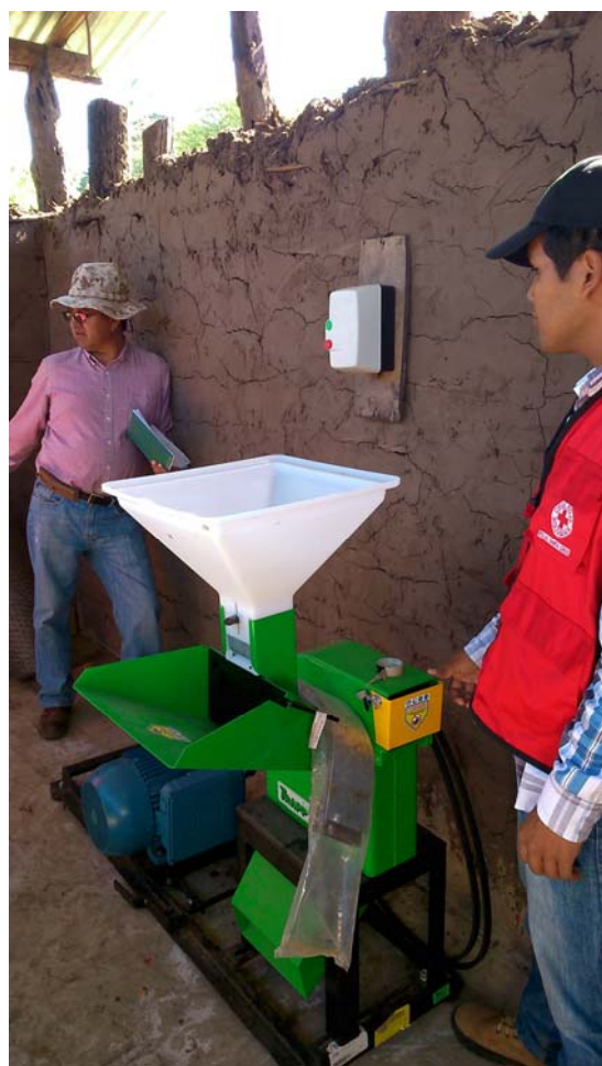
Instal·lació d'un molí elèctric