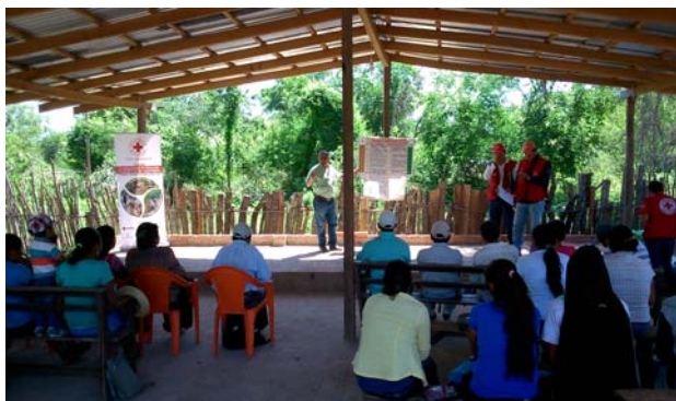
Trobades entre els beneficiaris/es per intercanviar experiències

Totes les activitats que s'estan duent a terme a través del projecte busquen la inclusió de la dona guaraní en activitats econòmiques remunerades i en la presa de decisions que afectin a la comunitat.