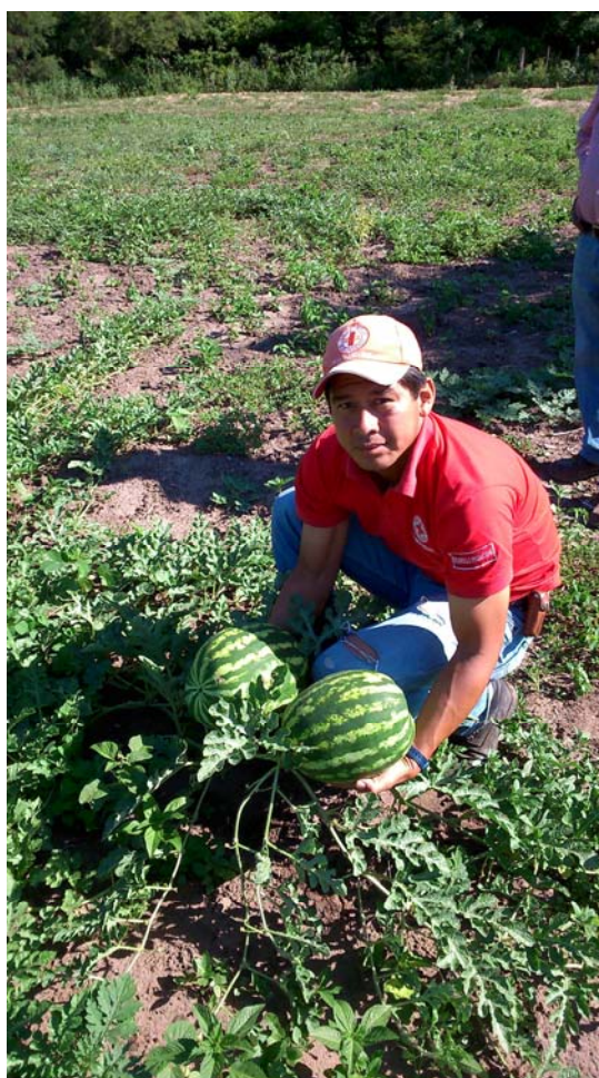
Producció d'hectàrees agrícoles

Humanitat Imparcialitat Neutralitat Independència Voluntariat Unitat Universalitat