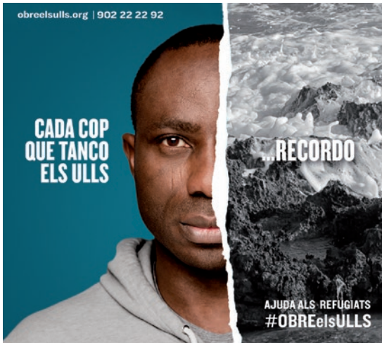
■ Cartell de la campanya #ObreElsUlls