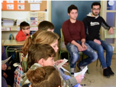
▶ Els infants de l'escola Alfred Mata de Puig-reig fan preguntes a dos joves refugiats.

Per preparar el taller d'avui, els alumnes han preparat i traduït, amb l'ajuda de la professora d'anglès, preguntes per plantejar als dos joves siris: "d'on són?, què feien al seu país d'origen?, per què van fugir?".