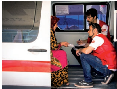
► Membres de la Creu Roja, atenent una dona refugiada a Skaramagas (Grècia).

Malgrat això, l'organització humanitària segueix garantint menjar a 45.000 persones al dia, a més de cobrir altres necessitats bàsiques (aigua potable, mantes