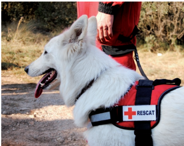
▶ Guia i gos de l'ERIE de Recerca i Rastreig amb Gossos.

en zones de risc (grans desnivells, coves...); i l'Equip de Sensibilització i Informació front Emergències (ESIE), especialitzat en atendre als infants i joves en situacions d'emergència. A més, és previst que abans de l'estiu la Creu Roja posi en marxa una Unitat Mòbil de Coordinació sobre terreny, vehicle equipat amb tota la tecnologia necessària per facilitar la tasca dels equips d'emergències.