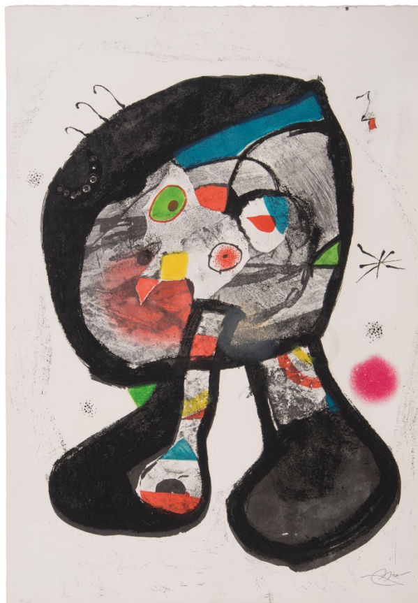
"Le Fantôme de l'atelier", 1987, 12. VI. 81 Aiguafort, 91 x 63,5 cm