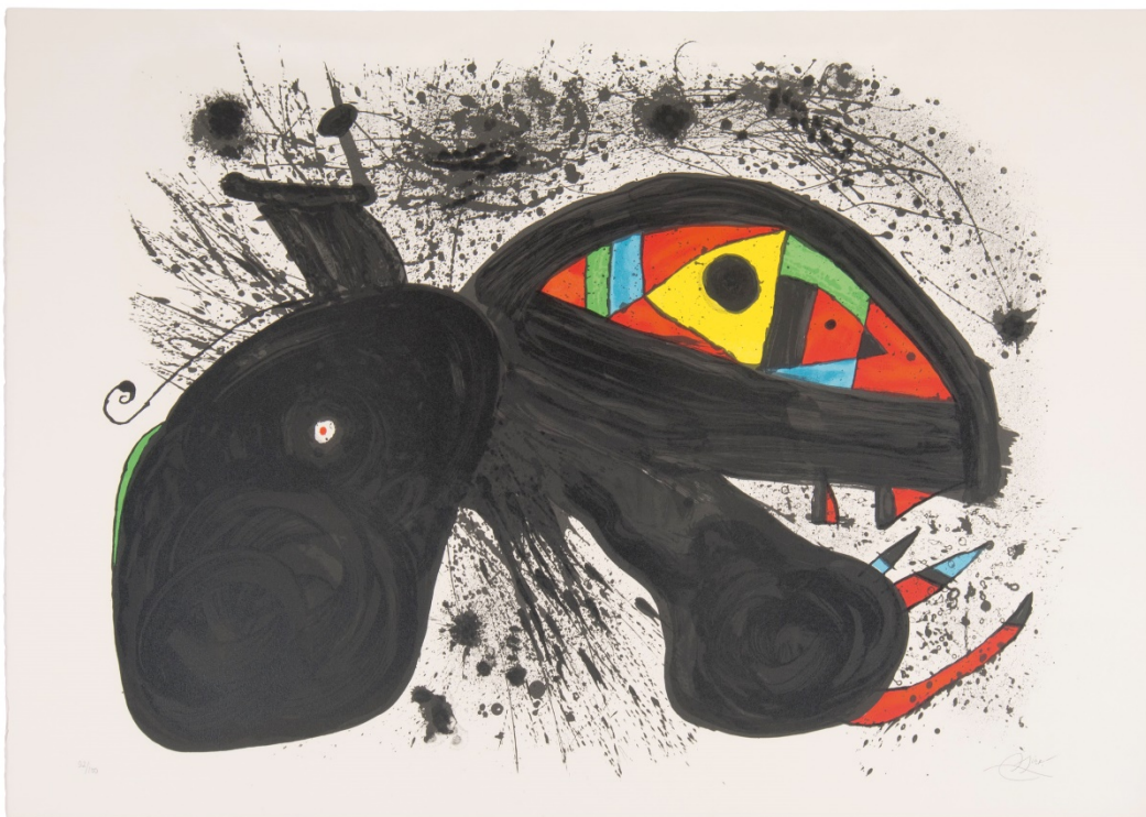
"Paysanne en colère", 1981 Litografia, 71,5 x 105 cm