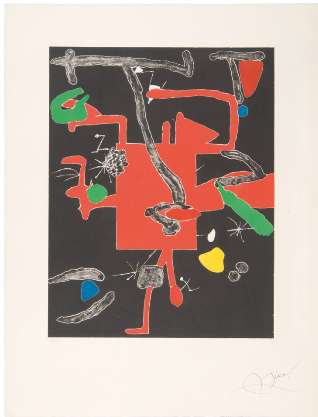
"Son Abrines I", 1987 aiguafort, 91,5 70 cm